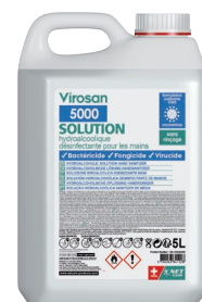
VIROSAN® 5000S bidon 5 litres référence : VR-OHAS5000