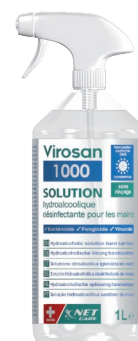
VIROSAN® 1000S flacon pulvérisateur 1 litre référence : VR-OHAS1000